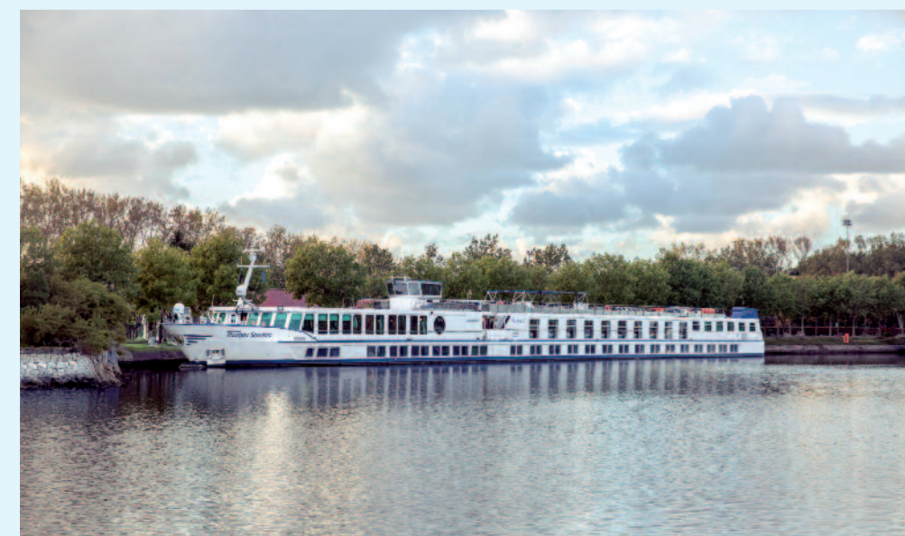
Die MS Thurgau Saxonia.

Nutzen Sie die freie Zeit nach dem Essen und schlendern Sie über den Striezelmarkt, welcher nicht nur der älteste Weihnachtsmarkt Deutschlands ist, sondern auch zu den berühmtesten weltweit zählt. Das Schiff bleibt über Nacht in Dresden liegen.