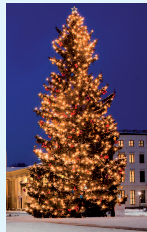
Weihnachtsstimmung in Berlin.