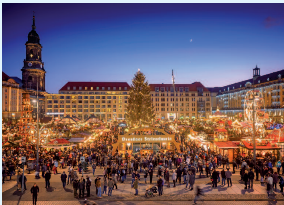
Der Striezelmarkt in Dresden.

Die Meissner Bürgerfrau führt Sie durch die romantischen Gassen der Innenstadt. Dabei erzählt Sie Ihnen die interessanten Begebenheiten und amüsanten Anekdoten aus Meissens Vergangenheit. Erfahren Sie so manches Gassengeflüster, Geschichte und vor allem Geschichten aus erster Hand. Seien Sie gespannt, welche kleinen Überraschungen die Bürgerfrau in Ihrem Körbchen für Sie bereithält. Oder Sie erleben einen Rundgang durch die histo-